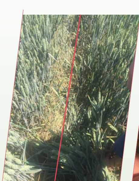
Третирано със Зантара®