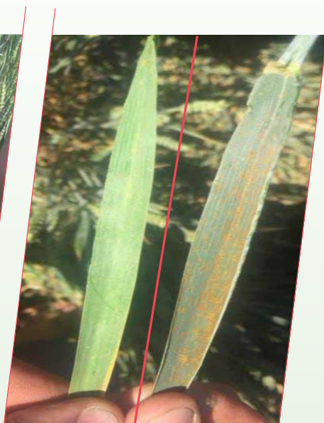
Третирано със Зантара®